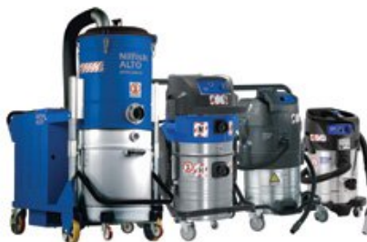
A kép illusztrációként szolgál.

Erős konstrukciójú, száraz-nedves felszívású, ipari porszívóinkat a nagy teljesítmény mellett számos kiegészítővel láttuk el, melyekkel növelheti hatékonyságát és csökkentheti költségeit. A beépített FlowSensor és az akusztikus figyelmeztető jelzés ellenőrzi a légsebességet a felszívócsőben, és figyelmeztet, ha a légsebesség nem éri el a minimum 20 m/másodpercet. A különböző átmérőjű gégecsövek használata egyszerűen beállítható az ellenőrző panelen.